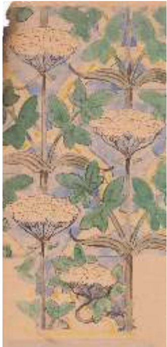
Projecte per a ceràmica Lluís Bru i Salelles Arxiu Municipal d'Esplugues de Llobregat (AMEL). Fons Taller Lluís Bru, c. 1905

Entre finals del segle XIX i començaments del segle XX, la natura va ser la gran musa i font d'inspiració d'arquitectes i artistes. Amb aquesta exposició volem mostrar com la flora, en particular, va esdevenir un dels repertoris per excel·lència de l'arquitectura modernista, la qual va arribar a establir un veritable diàleg amb el món vegetal a través de les arts decoratives.