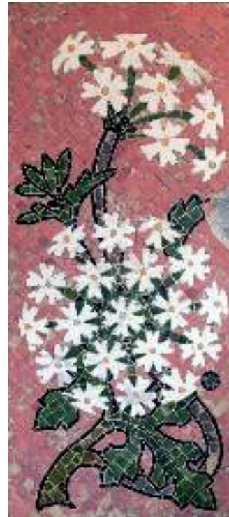
Mosaic ceràmic Fonda España de Barcelona, 1900-1903 Arquitecte Lluís Domènech i Montaner Casa Museu Lluís Domènech i Montaner (Canet de Mar)

En el tercer àmbit, « L'arquitectura, el jardí urbà », s'ofereix un passeig expositiu de flors i plantes que recreen un jardí gegantí i immutable a través de les arts aplicades als edificis, amb exemples representatius com la fulla d'acant, el card de bosc, el pi, la margarida o el castanyer d'Índia.