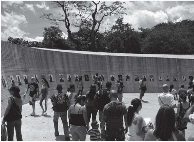
Museos y Territorio. Museo de Antioquia. Treballs i processos de museus i comunitats.

tes, residents de la zona, comerciants i altres persones per tal d'activar, investigar i generar imatges sobre el futur del carrer d'Edgware Road. Amb la proposta, es van generar projectes expositius, un web i projectes de col·laboració i residències a llarg termini amb diversos grups .