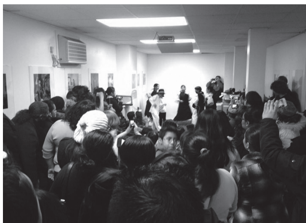
Balls equatorians per tancar el segon any de projecte a la seu del Movimiento Inmigrante Internacional .

la a partir de generar un espai de treball col·lectiu gratuït, en el qual es barrejen programes educatius, serveis de salut i assessoria per a les comunitats migrants de la zona, així com tallers de reparació de bicicletes, d'idiomes, de música, de dansa o d'estampació. Així mateix, s'hi organitzen altres activitats artístiques i culturals. El primer any, l'espai va generar el Manifesto Migrante , mentre que el segon any es va imposar una major participació i es va consolidar el treball amb el barri. Va esdevenir, així, un espai de referència per a diverses iniciatives de treball, entre organitzacions de base, serveis socials, iniciatives locals i altres tipus de programes. Durant el tercer any, el projecte ha generat un programa de lideratge amb un grup motor format majoritàriament per dones. ☺☺☺