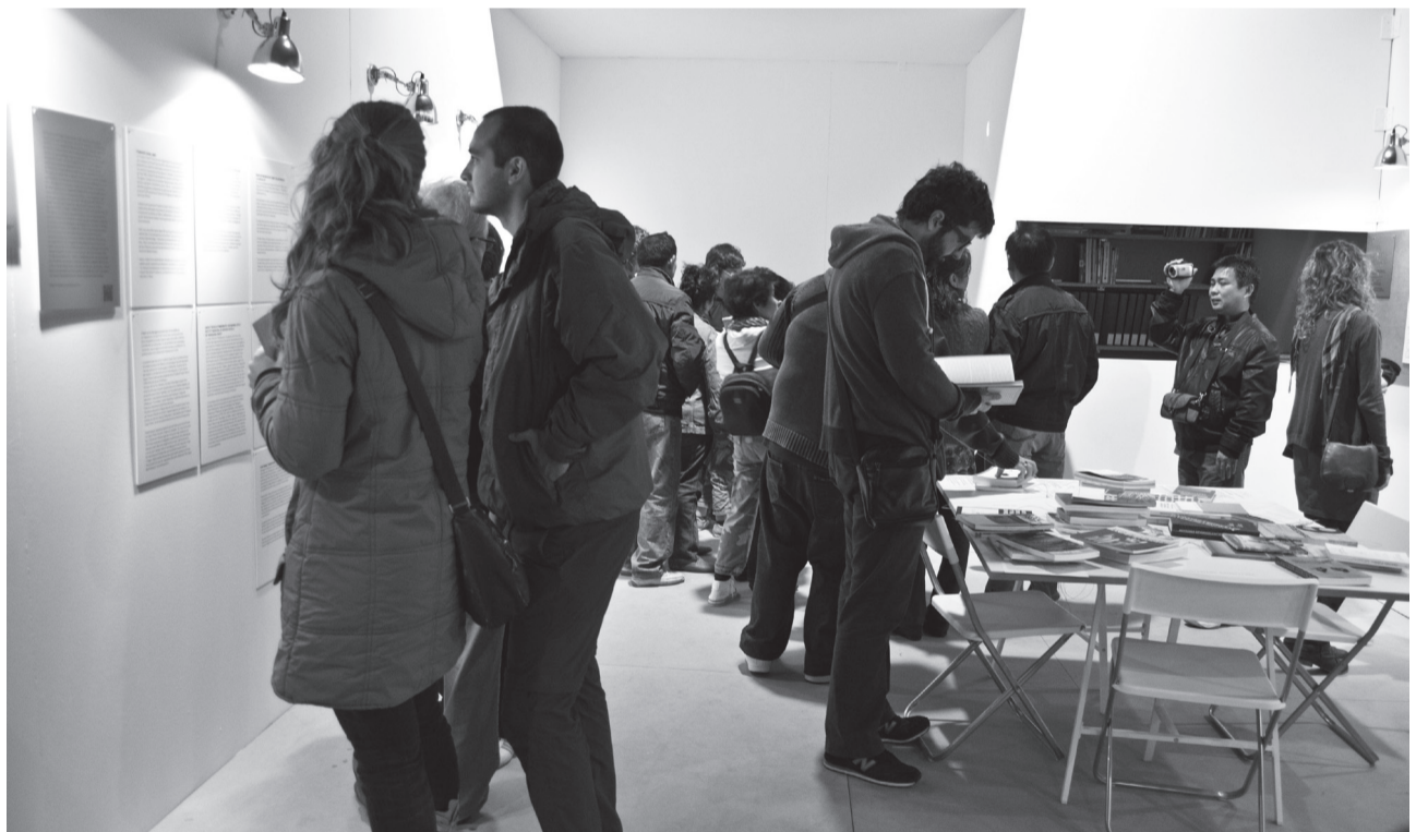
Espai de mediació i centre de recursos. LABmediació. Centre d'Art de Tarragona.

Museos y Territorio és el programa estable de relació amb comunitats del Museu d'Antioquia. Es tracta d'una àrea que és formada per un equip mixt en què hi ha treballadors socials i comunitaris, investigadors i educadors. El seu marc d'acció se situa tant a l'àrea metropolitana d'Antioquia com a la resta de la província a partir de treballar nocions crítiques de patrimoni, memòria i identitat des de la perspectiva de l'educació popular, el comissariat participatiu i el treball comunitari. Avui en dia, Museos y Territorio és format per quatre components: Museo Itinerante , Museo y Comunidad , i Mawí (espai virtual al web), a més de processos d'assesso-