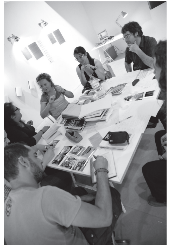
Taller en relació. LABmediació. Centre d'Art de Tarragona, 2013.

El CAC és localitzat en un espai de l'antic Hospital de Quito que va ser seu d'exposicions del Bicentenari. Anteriorment havia estat un lloc emblemàtic usat comunitàriament pel barri del seu costat, San Juan, mitjançant diverses ocupacions. La mediació del museu es va generar a partir de la realització de diversos tallers en què es va discutir i posar en qüestió els usos diversos de l'edifici. A partir d'aquests tallers es va començar a generar un arxiu de la memòria visual i oral sobre els modes d'habitar i els vincles del barri de l'edifici, fet que va donar peu a articular el programa de mediació amb el barri. A partir d'aquestes trobades, es van identificar les necessitats de disposar d'una sala del museu per mostrar la memòria i el treball de mediació, de cedir altres espais del museu a les comunitats (actualment en ús), així com d'iniciar la rehabilitació de la part posterior de l'edifici com un espai comunal per al barri. En aquest darrer àmbit, s'ubiquen un seguit d'elements que han estat fruit en major o menor mesura de la intervenció d'agents del barri, com és ubicar un hort comunitari que gestionen dones del lloc, una arquitectura generada amb artistes i una pista d'entrenament de parkour .