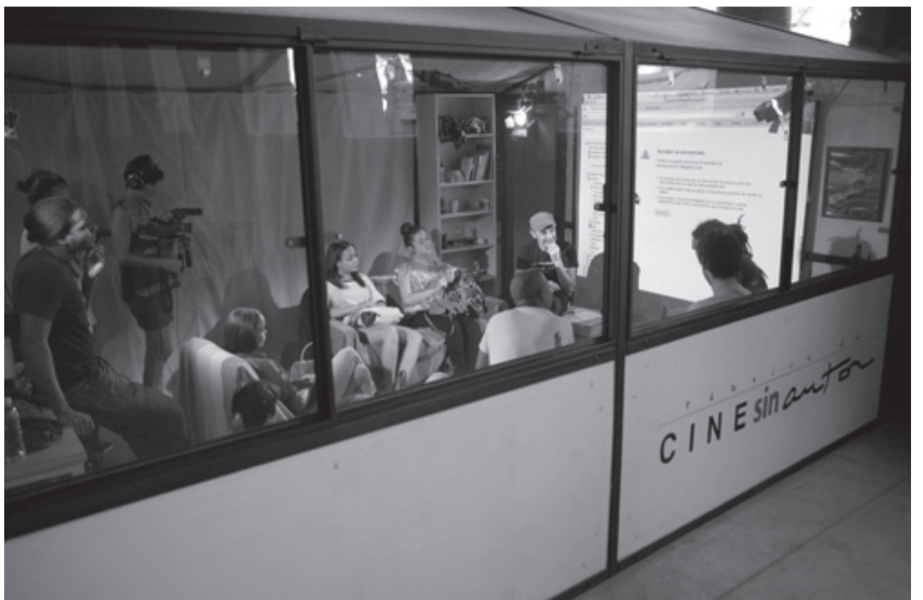
Espai de Fàbrica de cine sin autor. Intermediae.

nades de treball en xarxa anomenades «Obert per Reflexió». Va consistir en un seguit de trobades que es van generar amb diversos actors socials, culturals i comunitaris de l'entorn de Tarragona que van tenir lloc al llarg de gairebé tres mesos. D'aquest primer espai d'aprenentatges en xarxa, van sorgir tres grups de treball que van generar projectes d'autoaprenentatge sobre el treball col·laboratiu i en context, una plataforma de difusió en xarxa de les pràctiques de cultura del territori i una xarxa local sobre gestió cultural.