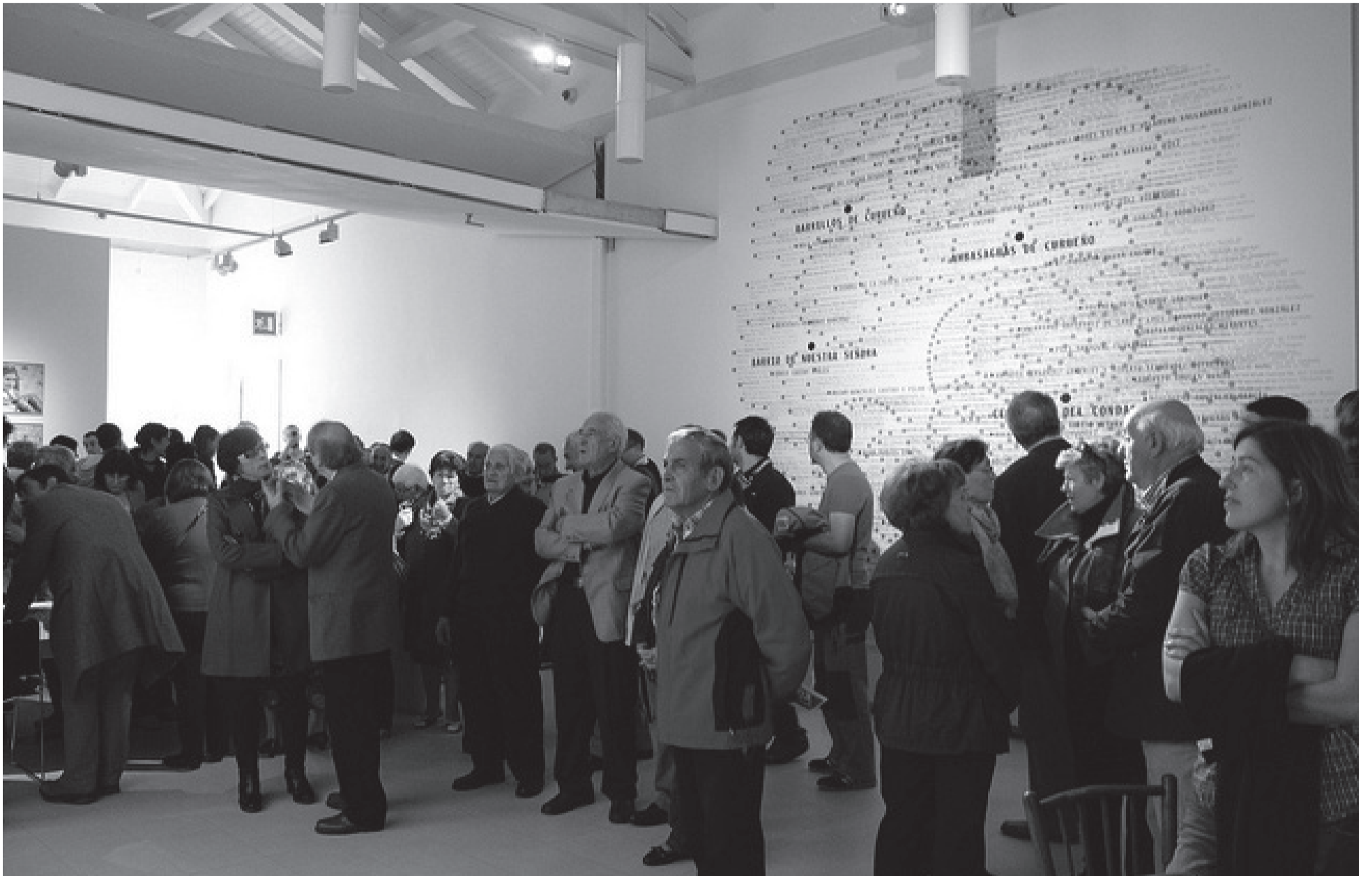
Inauguració de l'exposició «Territorio Archivo». Octubre del 2012.

Amb les pàgines següents oferim una petita mostra d'iniciatives de museus i institucions culturals d'arreu del món que estan generant temptatives i experiments sobre polítiques culturals i museologia. De maneres diferents, aquestes iniciatives entrecreuen les pràctiques d'art públic, la col·laboració i la mediació amb les comunitats. Podem considerar que es tracta de models que actuen com una frontissa o un espai transfronterer entre el museu i la ciutadania.