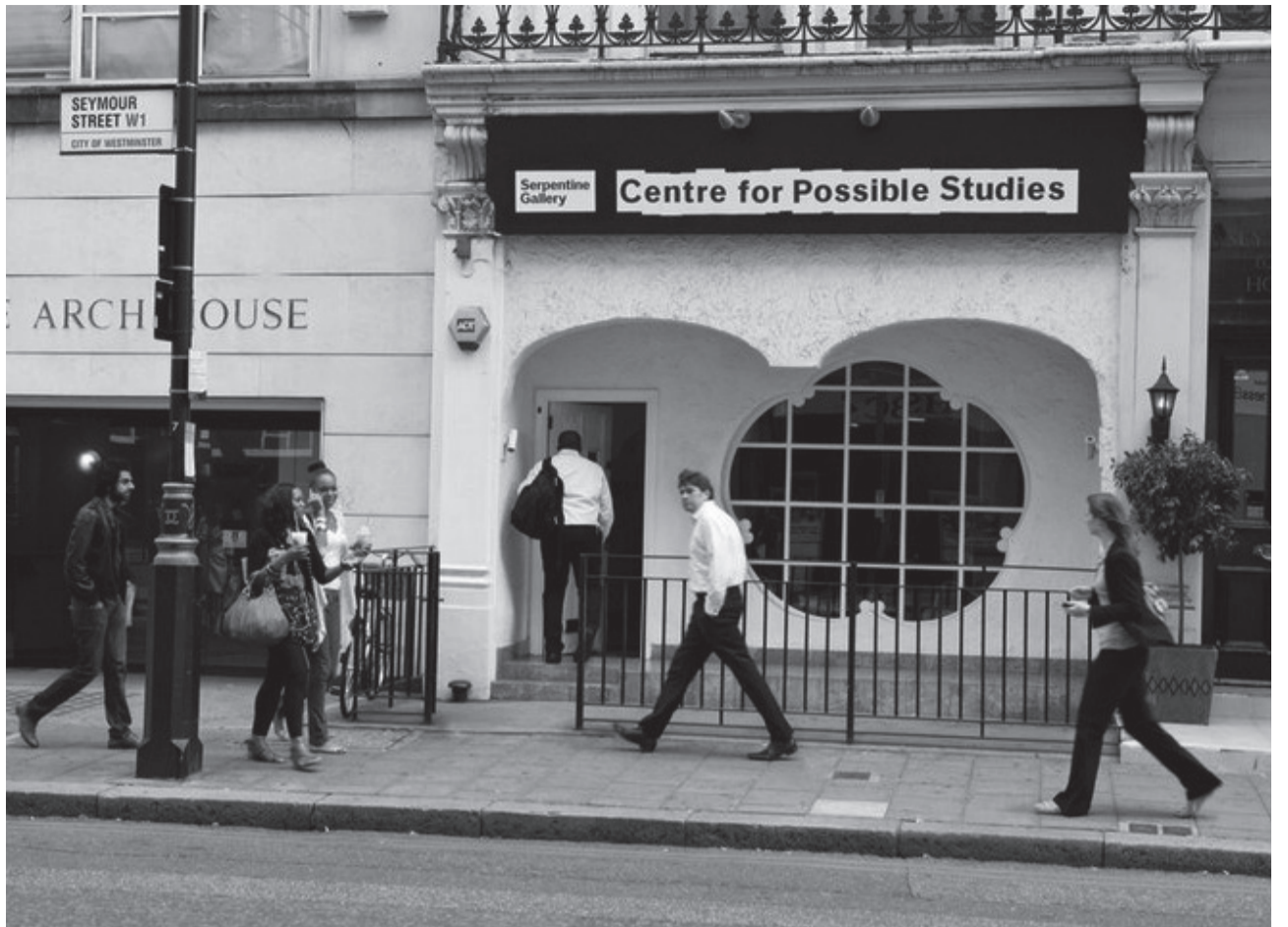
Centre for Possible Studies. Façana d'una de les seus del projecte

El Moviment de Immigrants Internacional és un projecte de col·laboració a llarg termini que va iniciar l'artista Tania Bruquer i que es desenvolupa al barri de Corona, Queens, el museu del qual ha generat una considerable activitat comunitària des del 2006. Aquest procés, que l'artista anomena «projecte sociopolític», sorgeix com una producció de Creative Times i del Queens Museum a partir d'una invitació específica a l'artista per treballar al barri. El projecte disposa d'una botiga com a base fixa a Corona i s'articu-