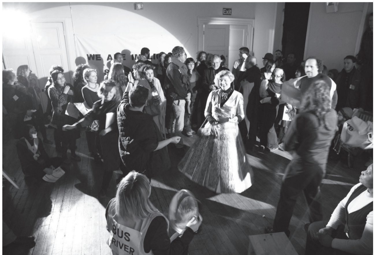
«Embassy Ball». Acció d'Implicated Theatre Embassy, 2013.