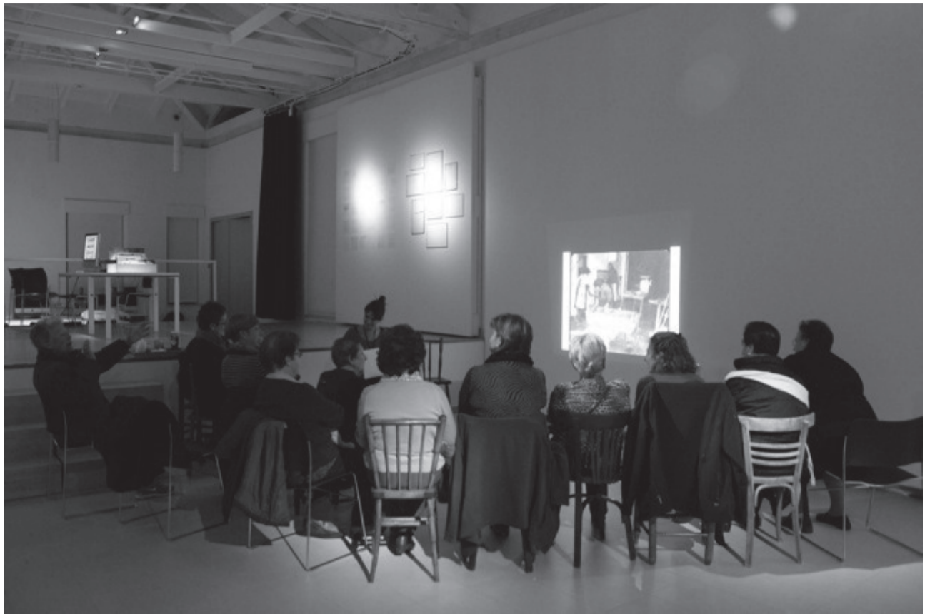
Filandón de Ambasaguas: reunions amb els veïns d'Amasaguas del Curueño per generar discussions a l'entorn del material fotogràfic de «Territorio Archivo». Novembre del 2012.

LABmediació va desenvolupar entre el 2011 i el 2013 una investigació pràctica i teòrica sobre els potencials i les contradiccions de les pràctiques de mediació entre l'esfera artística i social. Es va desplegar per mitjà d'articular una relació transversal amb els demés programes del Centre d'Art de Tarragona (CAT). Va iniciar la seva activitat amb unes jor-